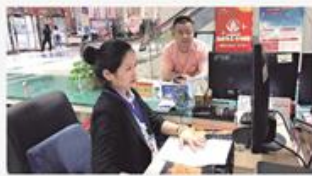
市行政审批服务局帮办代办工作人员接待群众办事。

打造“水城帮办”市、乡、村四级体系，实现全市政务服务帮办代办全覆盖。市行政审批服务局按照政治素质好、责任心强、业务熟练的原则，配齐配强“水城帮办”帮办队伍。在市、县两级行政审批服务局配备专职“水城帮办”人员，为群众企业提供帮办代办服务。在全市137个乡镇、街道、园区便民服务中心及4881个村社区便民服务中心，通过选派帮办“水城帮办”人员，为群众企业提供帮办代办服务。今年4月底，全市“水城帮办”帮办队伍组建完毕，“水城帮办”工作人员达4300余人，实现了全市政务服务帮办代办全覆盖。