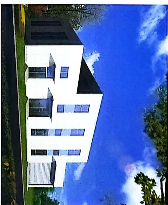
污泥脱水机房效果图