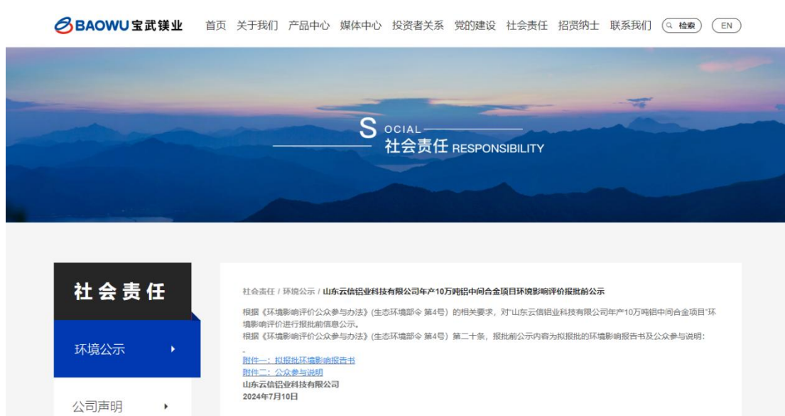
图 4.2-1 报批前信息公开网站截图