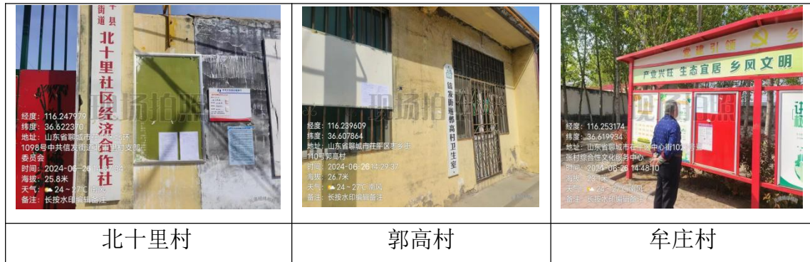
图 3.1-2 征求意见稿公众参与张贴公示现场照片

我单位在距离项目厂址相对较近的村庄敏感点（北十里村、郭高村、牟庄村）张贴公告，公示时间：10 个工作日（2024.6.26——2024.7.9），符合《环境影响评价公众参与办法》要求。现场照片如下：