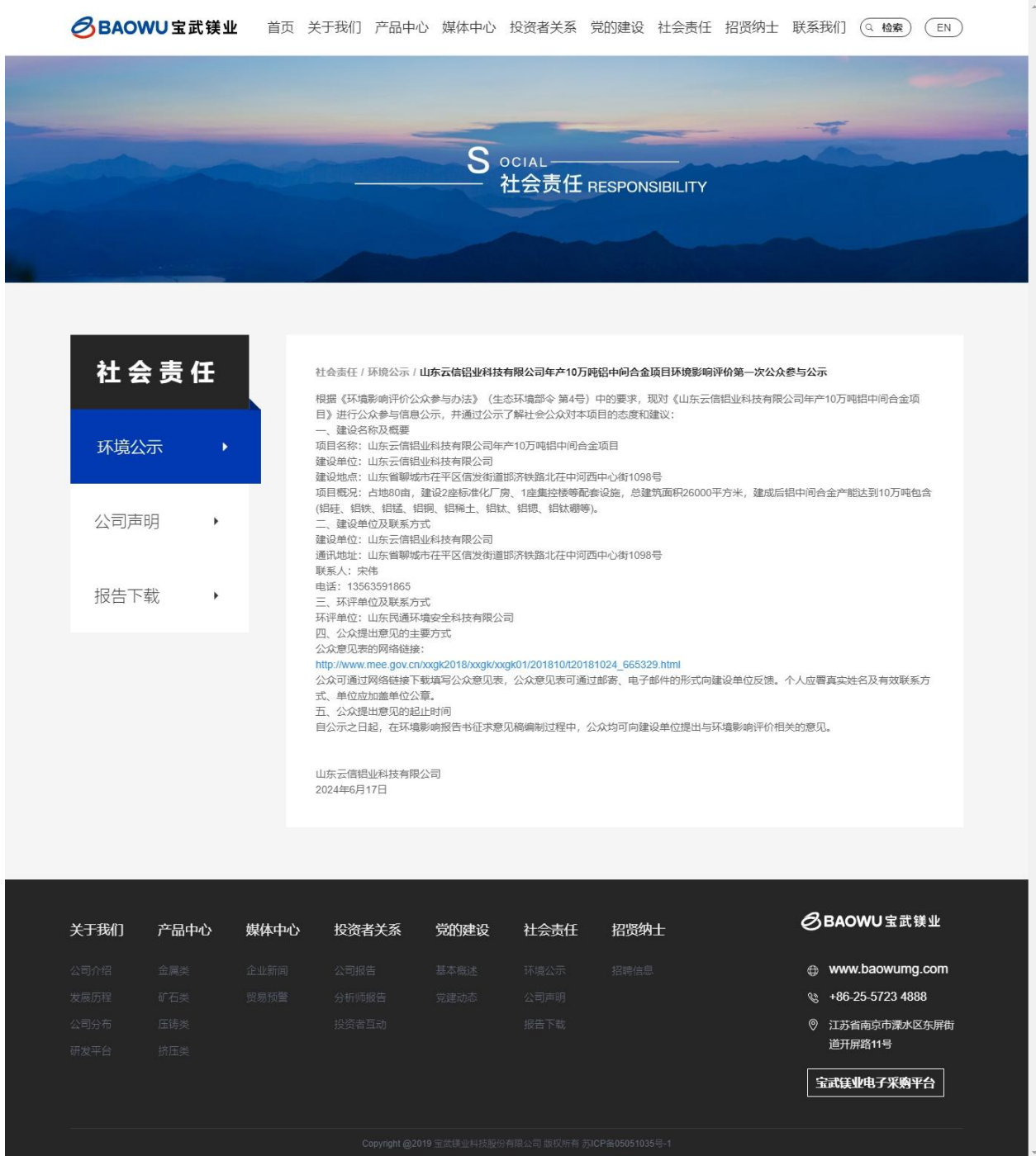
图 2.1-1 首次环境影响评价信息公开网站截图