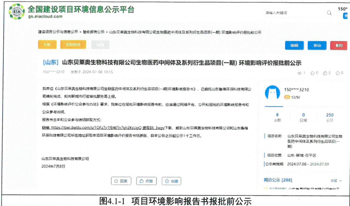
图4.1-1 项目环境影响报告书报批前公示